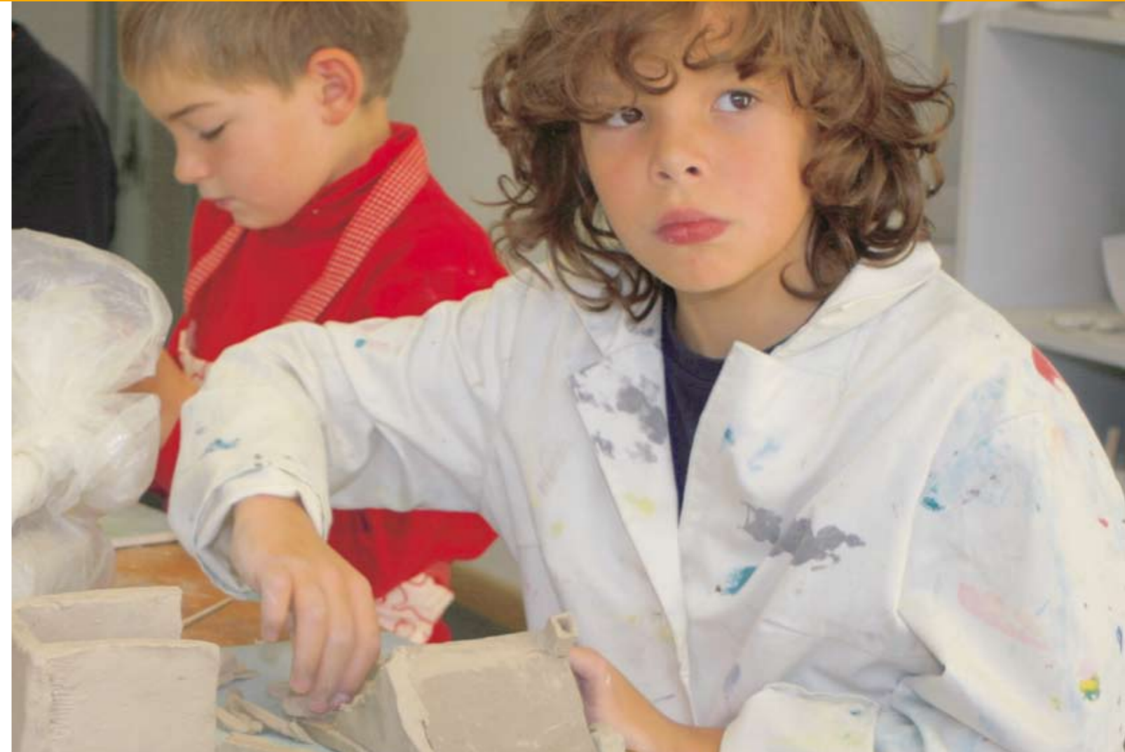
Ein Dutzend Kreativwerkstätten erwartet Kinder und Jugendliche in der gelben Villa.