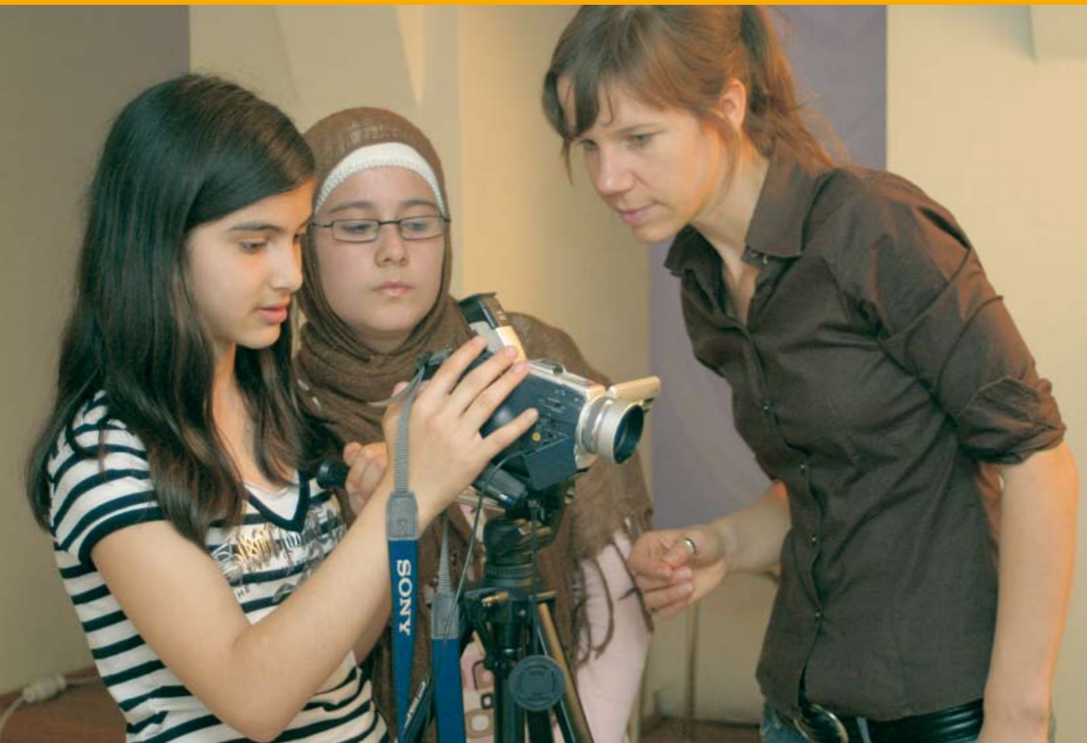
Der Umgang mit Medien wird praxisnah geübt.

Wie versende ich eine E-Mail, kann man sich im www verlaufen, was ist eigentlich eine Bluebox und wie wird aus meinem Urlaubsfoto ein CD-Cover? Medien bestimmen den Alltag von Kindern und Jugendlichen auf Schritt, Tritt und Mausklick. Auch in der Schule können sie durchaus nützlich sein. Medienkompetenz ist eine Schlüsselkompetenz und stellt wichtige Weichen für die Zukunft. Die medienpädagogischen Angebote der gelben Villa haben gleichzeitig das Üben und konkrete Anwenden wie den bewussten und sinnvollen Umgang mit PC und Internet, mit Video, Digitalkamera oder dem Fernsehen zum Ziel. Die moderne Medienausstattung im Haus ist bei Schulklassen wie Hortgruppen gleichermaßen beliebt. Die Medienwerkstätten vermitteln Kindern ab sieben Jahren einerseits das nötige Handwerkszeug, andererseits auch feste Regeln und mögliche Gefahren bei der Nutzung verschiedener Medien. In wiederkehrenden